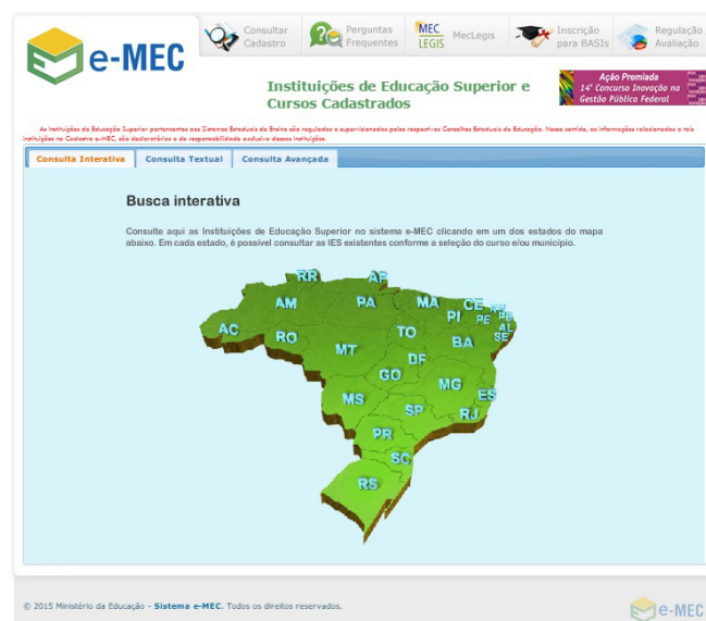
Figura 1: Página oficial do e-MEC - Busca interativa das instituições por estado.

Para análises os dados foram tabulados da seguinte forma: atribuíam-se o código 0 para os casos de ausência e o código 1 para a presença de cada uma das tecnologias da informação e comunicação avaliadas. Em seguida os dados foram submetidos a testes estatísticos para avaliação.